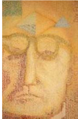
Jenna Lash, Le Corbusier Swiss Franc, 2006, tecnica mista su tela, 60x90cm [Vedi la foto originale]

K 10 vai alla scheda di questa sede Exibart.alert - tieni d'occhio questa sede Via Luigi Lavizzari 10 (6900) +41 765616784 (info) www.klausmuhlhausser.ch individua sulla mappa Exisat individua sullo stradario MapQuest Stampa questa scheda Eventi in corso nei dintorni